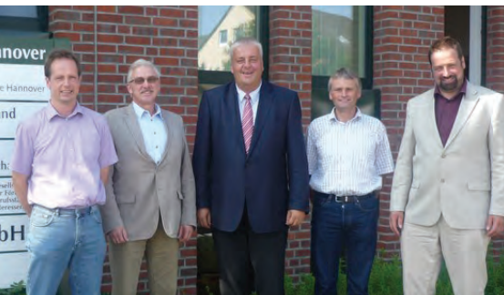
Burkhard Balz MdEP mit Vorstandsmitgliedern des Landvolk-Kreisverbandes Hannover

Hannover. Ein regelmäßiger Austausch mit Verbänden und Vereinigungen ist für Burkhard Balz eine Selbstverständlichkeit. So besuchte er am 22. August 2011 das Grüne Zentrum in