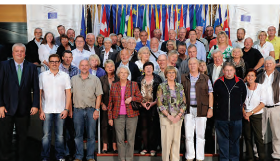
Burkhard Balz mit Besuchergruppe