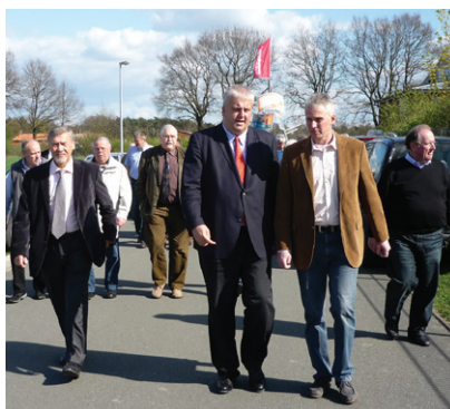
Burkhard Balz beim Rundgang über das Gewerbegebiet Drakenburg