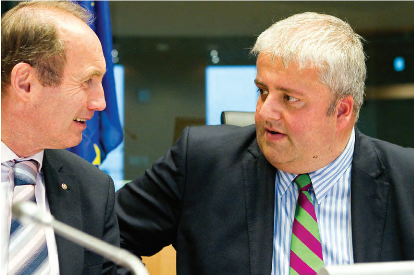
Burkhard Balz mit dem österreichischen Abgeordneten Othmar Karas bei den Beratungen zum Stabilitäts- und Wachstumspakt

Die Schuldenkrise im Euroraum, besonders die sich zuspitzende Situation in Griechenland, bestärkt die Europaabgeordneten in ihrer Forderung nach einem strengen, haushaltspolitischen Regelwerk. Es soll präventiv eingreifen, wenn mittelfristige haushaltspolitische Ziele verfehlt werden. „Die anhaltende Diskussion um die Euro-Rettungspakete lässt unsere Bürgerinnen und Bürger am Gestaltungspotenzial der Politik zweifeln. Dabei können wir gerade bei der Reform des Stabilitäts- und Wachstumspakts die richtigen Wegweiser für die Zukunft aufstellen. In ihrem eigenen Interesse sollten auch die Regierungen der Mitgliedsstaaten das Signal für eine deutliche Verschärfung der haushaltspolitischen Überwachung geben“, so Burkhard Balz zum gegenwärtigen Verfahrensstand.